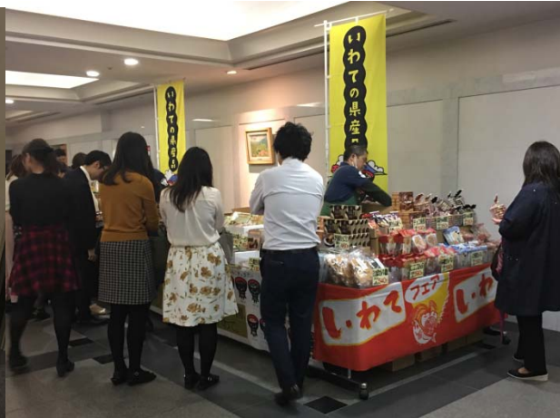
<復興支援マルシェ>